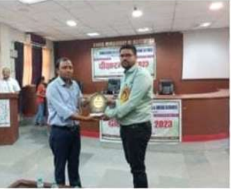
सुलतानपुर में कमला नेहरू संस्थान के फरीदपुर कैम्पस स्थित