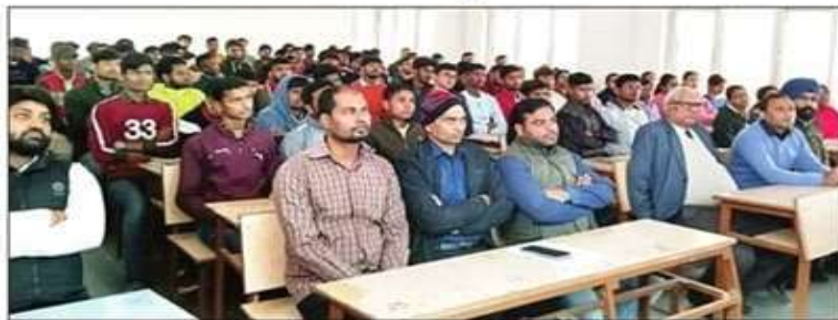
केएनआई फरीदीपुर में प्रधानमंत्री के संबोधन को देखते सुनते विद्यार्थी व स्टाफ।

विद्यार्थियों ने भारत को विकसित राष्ट्र बनाने का लिया संकल्प