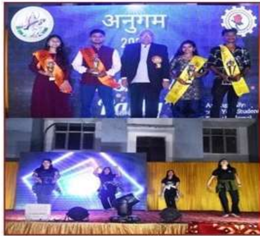
छात्रों को सदैव अपने लक्ष्य के प्रति केन्द्रित रहने को कहा। डा.