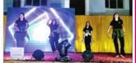
केएनआई पीएसएस फरीदीपुर कैम्पस में नृत्य करती इंजीनियरिंग की छात्राएं।