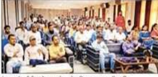
फारिदपुर फरीदपुर में हुए कार्यक्रम में शामिल छात्राध्यक्ष व विद्यार्थी।

यह कार्यक्रम आल इंडिया काउंसिल ऑफ टेक्निकल एजुकेशन तथा एकेटीए के दिशानिर्देशों में 12 अक्टूबर तक चलेंगे। मंगलवार को कार्यक्रम में मुख्य अतिथि के रूप में कमला नेहरू इंस्टीट्यूट ऑफ फिजिकल एंड सोशल साइंसेज